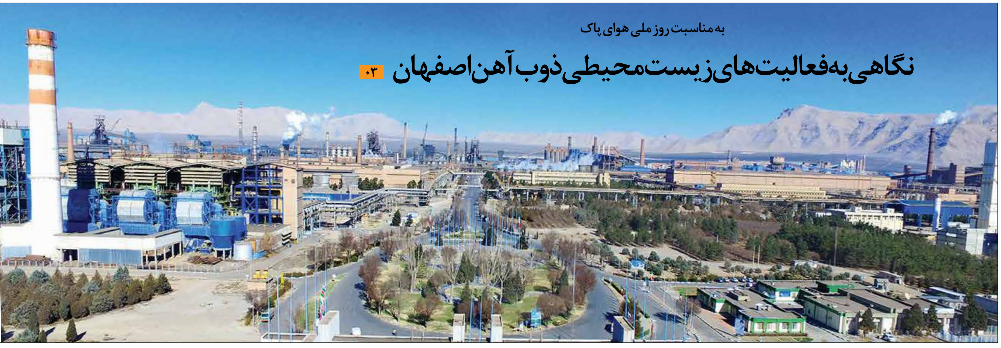
به مناسبت روز ملی هوای پاک