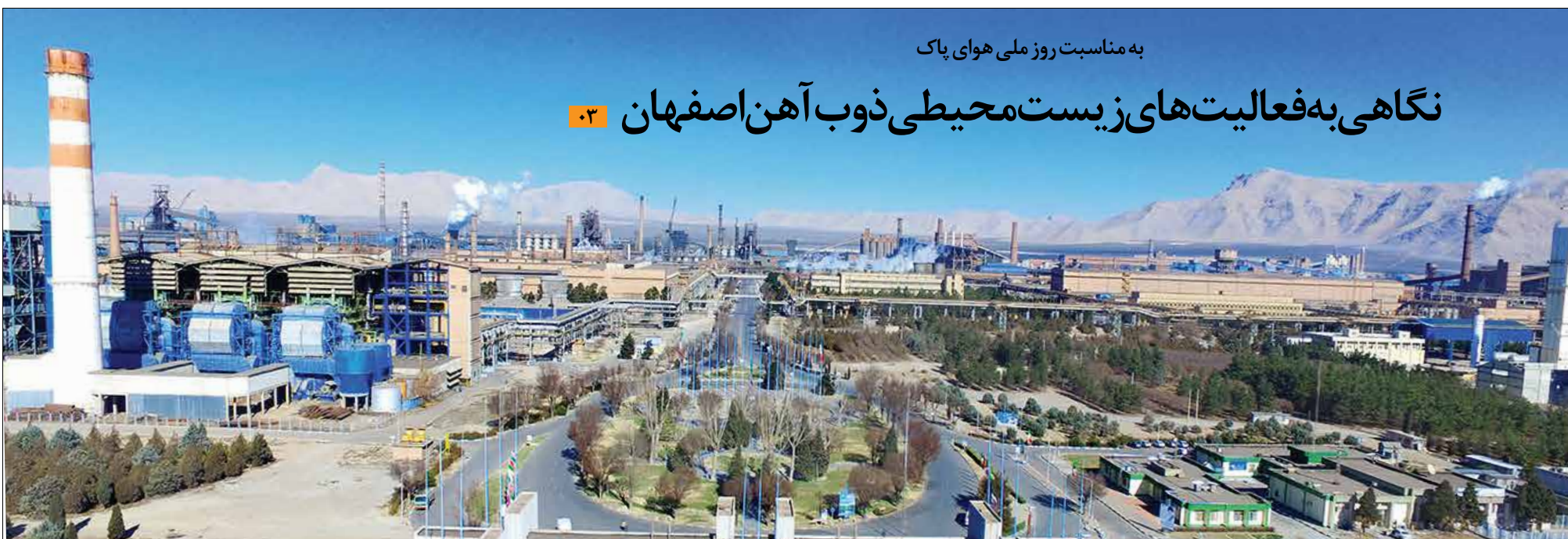
به مناسبت روز ملی هوای پاک