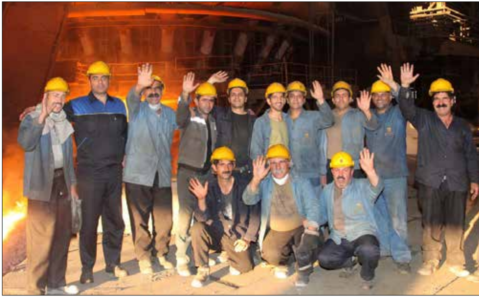
۹۹/۹۹۵ فعالیت های انجام شده در جهت بازسازی و ساخت قطعات باهمت و تلاش پرسنل، همواره بسیاری از قطعات و تجهیزات بخش های

موارد ذکر شده فوق توسط مدیریت های راه آهن و ترابری، تولیدات کک و مواد شیمیایی و اتوماسیون و ارتباطات انجام شده است. مدیریت های مهندسی نورد امور فنی بهره برداری، تولید و توزیع برق، فولادسازی، آگلومراسیون، انرژی و بهینه سازی مصرف سوخت و سایر بخش های تولیدی و مهندسی حوزه معاونت بهره برداری نیز در موضوعات مختلف طراحی، ساخت، تولید محصول جدید اقدامات صرفه جویی، بازسازی قطعات و ... فعالیت دارند که قابل تحلیل است.